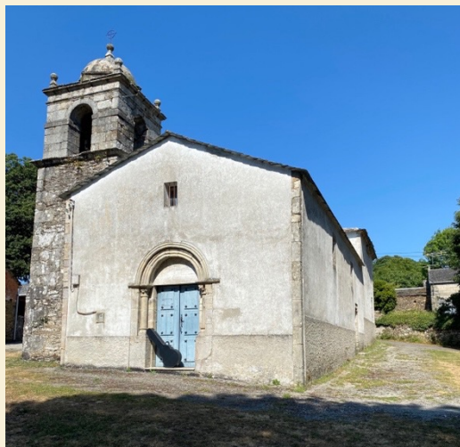
Ermita de Valonga

En el repertorio encontramos temas antiguos: “Poble Sec” y “Rabassada”, de La Nit (2012); “Tanguillo Bipolar”, de Ombra de Lúa (2020). El resto son composiciones post-pandemia. “La roda y la gàbia” y “Portes Tancades” son parte de una fantasía en torno al funcionamiento de la rueda del hámster. “8 anys”, “Bifurcacions”, “Reinici”, “Reconsideració” y “Ni un pas enrere” son piezas nacidas de improvisaciones en la ermita de Santa María de Valonga (Lugo)