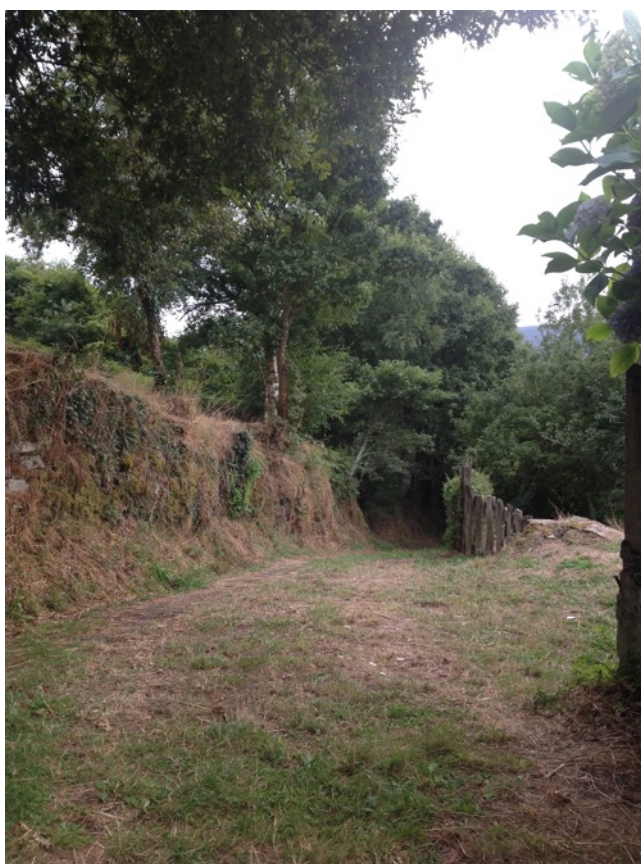
Camí a l'entrada

Era el primer dia allí. Tots els records frescs però una barreja de coses a dir i coses a deixar passar. Tant m'afecta lo del papa? O puc dir que ja l'he plorat cada cop que havia anat d'urgències, i llavors no estic gaire afectat o si? Portàvem anys així. O és que la pena pel papa és una pena respectable, tothom ho entén, és fàcil amagar-se al darrere i no entrar en la resta de coses que també son importants? Els nens corren per la casa, hauria de anar a reconèixer el terreny amb ells? O me'n vaig a l'habitació a muntar la parada i veure com sona lo meu?