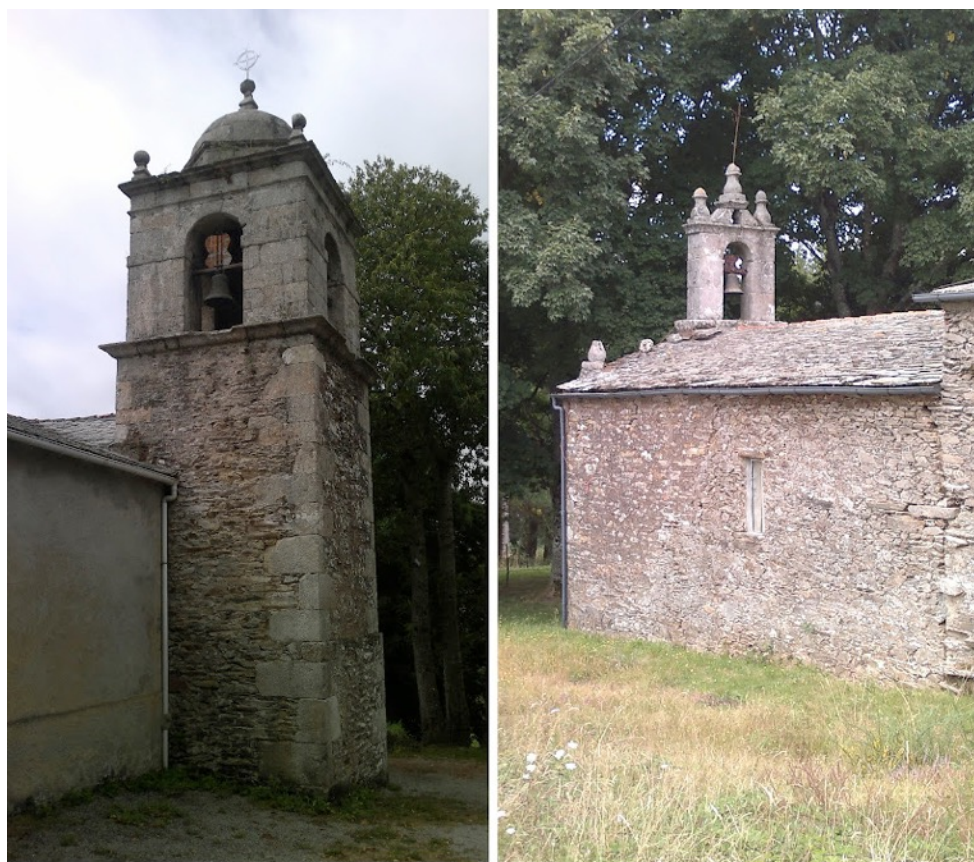
Igrexa de Santa Maria de Valonga / Capela de San Ramon de Penamazada

Al 2012 vaig enregistrar l'àlbum "La Nit", també de baix acústic sol. Les gravacions les vaig fer a la Igrexa de Santa Maria de Valonga i a la de San Ramon de Penamazada , ambdues prop de Meira. Totes dues són ermites més petites, una sola nau de uns vint-i-cinc metres de llarg. La reverberació és també extraordinària, i el soroll de fora depèn de la climatologia, que no del trànsit rodat. Vaig aconseguir unes bones gravacions malgrat sorolls ocasionals, campanades inesperades, tractorades properes, gallinàcies, etc. Però no va ser possible aprofitar el que recollien els micros posats "escoltant" el eco; la raó és que el sostre és molt baix i el soroll de la ventada queda enregistrat com si hagués soroll blanc massa important.