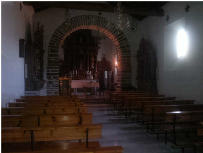
Interior de l'ermita de Airexa

acabava de fer una impro amb notes llargues i harmònics, amb la sensació creixent de que no estava sol del tot, allí davant l'altar, amb família enterrada uns metres enllà de la pared i en aquella ermita edificada sobre un antic cementiri celta. Pensar en un malson era en aquest moment un pel agosarat.