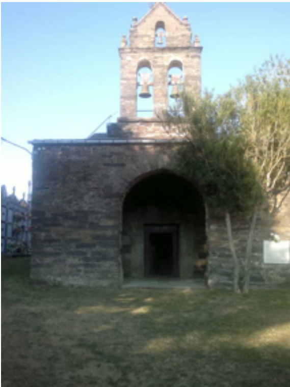
Igrexa de Piñeira, en Airexa