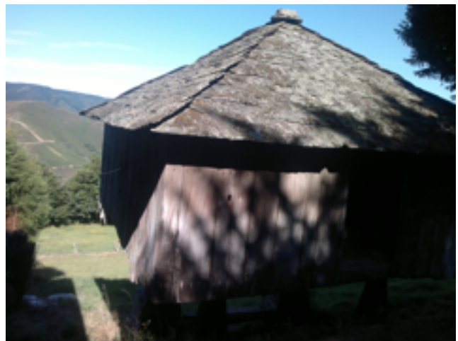
Hórreo de casa

Al 2009 vaig enregistrar el meu primer àlbum, AKIXÍ , fent servir el hórreo com a estudi de gravació (bé, en moltes de les peces, no en totes). La sonoritat del hórreo és molt particular, és un quadrat aproximadament de cinc metres de costat, i té una habitació quadrada dintre, deixant un passadís exterior. Per tant, des de dintre hi ha dos parets per arribar a fora, això aïlla prou bé