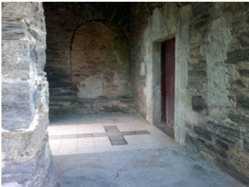
Porta de l'ermita de Piñeira des del jardí

Aquí sembla que podríem parar. He parat la gravadora. Ha estat mitja hora productiva. Bon moment per sortir a prendre l'aire.