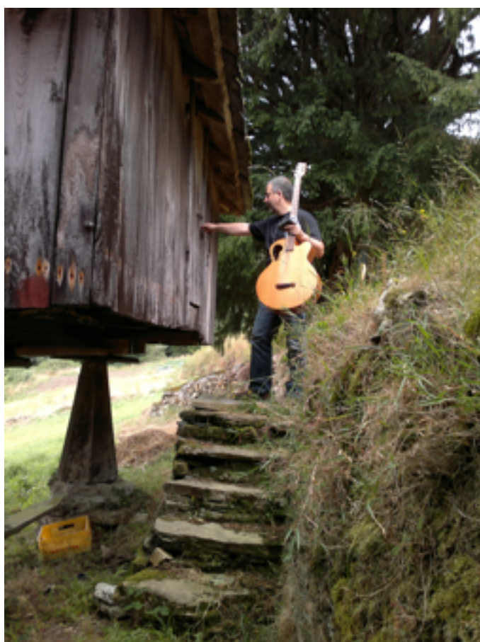
A l'escaleta per entrar al hórreo

Gravar al hórreo no és senzill. Els dies de ventada hi tens molt soroll de fons, hi ha dies que algun veí ve a passar el tractor per algun camp proper o ve alguna màquina a tallar eucaliptols, o hi ha alguna gossa en cel i els gossos del voltant passen bordant tota la tarda. Aquest any ja no tenim abelles, però altres anys hi havia un moment en que anàvem a recollir la mel i, a partir d'aquell dia, l' hórreo quedava copsat. Per això és qüestió de tenir-ho tot a punt, no planificar gaire, més aviat improvisar, i si aquesta tarda tenim les condicions, endavant.